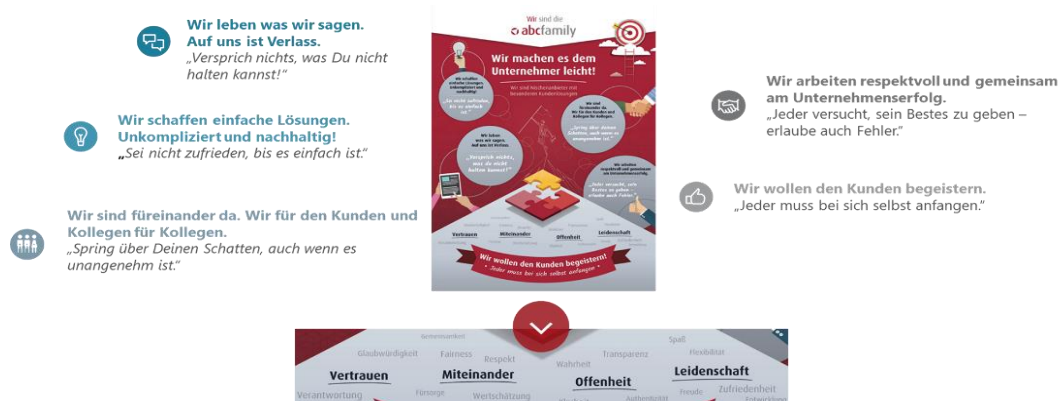
Abbildung 5: Leitbild der abcfinance

Der GB abcfinance verfolgt eine klare Vision, welche in einem von allen Mitarbeitern gelebten Leitbild mündet. Dies wurde im Jahr 2017 in einem breit angelegten, partizipativen Prozess von allen Mitarbeitern und Führungskräften erarbeitet. Die Basis des gemeinsamen Wertekodex liefert allen Mitarbeitern eine Orientierung für ihr tägliches Handeln und beruht auf 15 gemeinsamen Werten, die unter vier Überschriften zusammengefasst wurden. Die vier wichtigsten Werte des GB abcfinance sind: