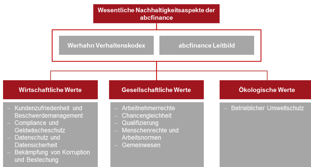
Abbildung 3: Wesentliche Nachhaltigkeitsaspekte der abcfinance

Abgeleitet aus dem Werhahn Verhaltenskodex und dem abcfinance Leitbild wurden die unter Berücksichtigung des Geschäftsmodells und in der Regulatorik vorgesehenen Berichtspflichten wesentlichen nichtfinanziellen Werte – unterteilt in wirtschaftliche Werte, gesellschaftliche Werte und ökologische Werte – identifiziert: