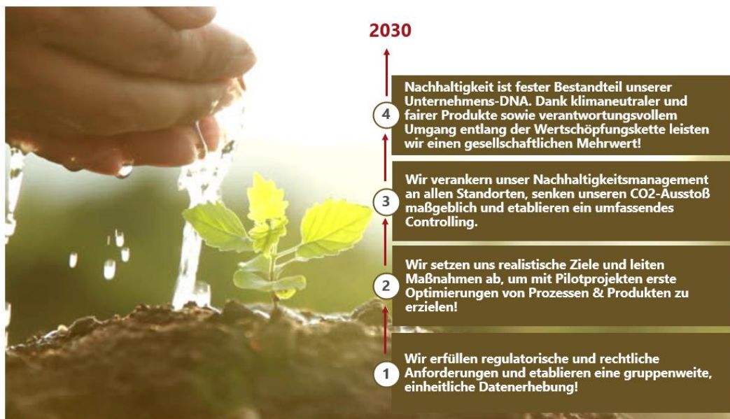
Abbildung 4: Die Sustainability Roadmap 2030

Unsere Vision ist, im Jahr 2030 als nachhaltig agierender Finanzdienstleister wahrgenommen zu werden. Intern verankerte Maßnahmen entlang der Nachhaltigkeitsstrategie sollen umgesetzt sein und werden kontinuierlich weiterentwickelt. Damit einhergehend soll auch ein Beitrag zu ausgewählten und definierten Zielen der Vereinten Nationen geleistet werden. Im Jahr 2030 sollen die auf Basisjahr 2023 basierenden Abbaupfade erfüllt sein. Darüber hinaus werden wir die Transformation unserer Kunden mit attraktiven Finanzierungsmöglichkeiten begleiten.