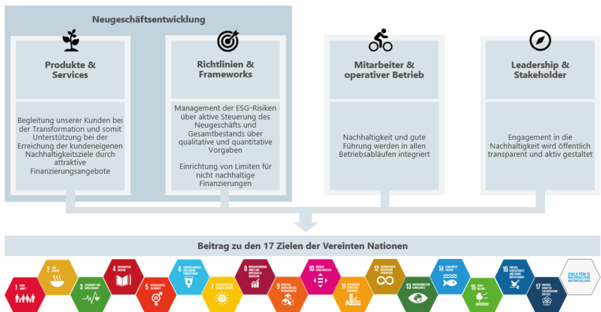
Abbildung 2: Ganzheitliche Nachhaltigkeitsstrategie der abc-Gruppe

Strategische Treiber werden insbesondere durch die seitens Regulatorik erforderlichen Transformationspläne definiert.