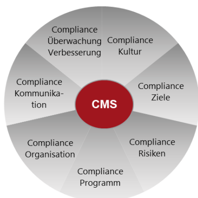
Abbildung: Grundelemente des abcfinance Compliance Management Systems

Unter Compliance wird die in der Verantwortung der Geschäftsführung liegende Sicherstellung der Einhaltung gesetzlicher und regulatorischer Bestimmungen durch das Unternehmen verstanden. Die Grundelemente des Compliance Management System (CMS) des Geschäftsbereichs abcfinance stellen sich wie folgt dar: